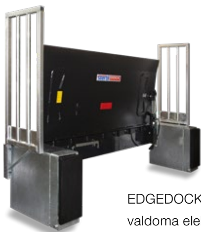
EDGEDOCK/HA Serija: valdoma elektra-hidraulika

LA Serija: rankinio valdymo reikalavimai