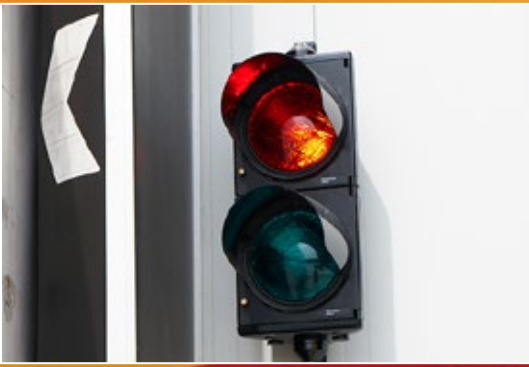
Garso ir vaizdo signalai.