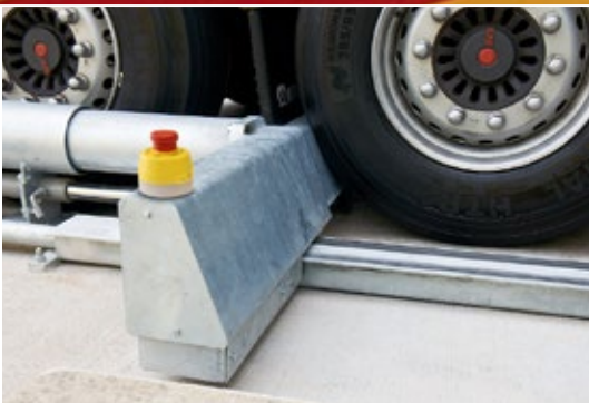
Ratų blokas pastoviai spaudžia ratus, kad apsaugotų transporto priemonę nuo šliaužimo į priekį.

žemės. Transporto priemonės kelyje neturi būti jokių kliūčių ir jokių kontaktų su judančiais sunkvežimiais. Tik sunkvežimio ratai, kurie šoniniais vamzdžiais nukreipiami prie rampos. Sunkvežimio apačia ir ratų arkos visada išlieka laisvos.