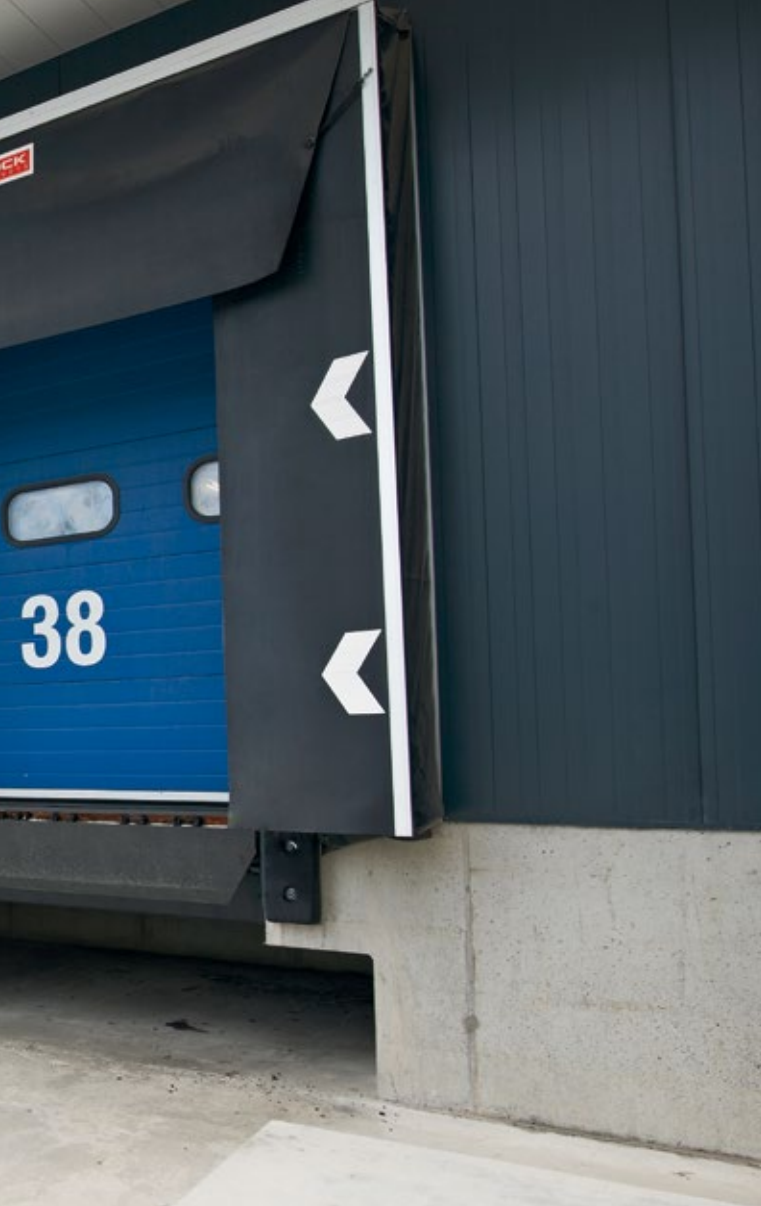
Stabilus rėmas (WSP)