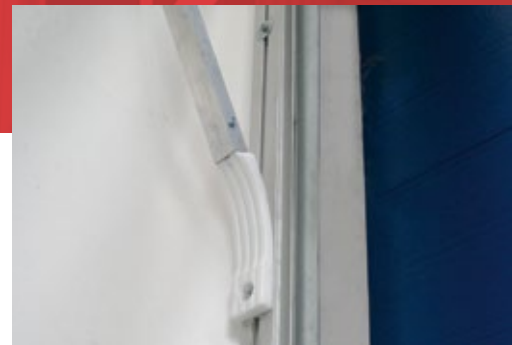
Lankstus aliuminio rėmas